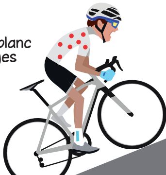
Le maillot blanc à pois rouges

Le maillot blanc à pois rouges récompense cette fois le meilleur grimpeur. On l'appelle aussi le champion du Grand Prix de la montagne.