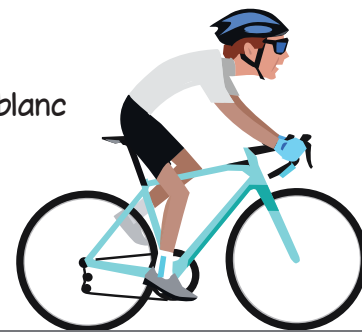
Le maillot blanc

Créé en 1975 le maillot blanc récompense le meilleur jeune, c'est-à-dire le cycliste de moins de 25 ans dans l'année qui a fait le meilleur temps à la fin de la course.