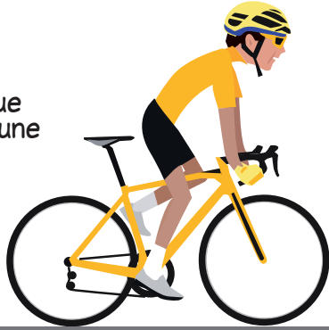
Le mythique Maillot Jaune

Le Maillot Jaune est sûrement le plus important de tous les maillots puisqu'il récompense le vainqueur de la course.